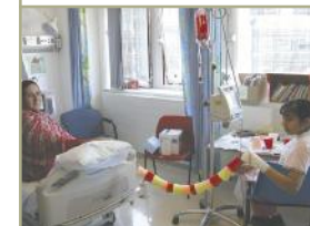
Ani interiér londýnské nemocnice se na první pohled ničím nevymyká tomu, jak dnes vypadají mnohá nemocniční oddělení u nás.