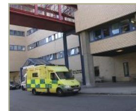
Moderní nemocnice St. Mary's v centru Londýna. Zvenčí se od našich nemocnic ničím podstatným neliší.

Britská praxe také dokládá, že přijímání rodičů do nemocnice není v první řadě otázkou peněz a komfortního zázemí. I ve stísněných prostorách se při dobré vůli místo pro rodiče vždycky najde. Poměrně častým řešením rodičovského noclehu je položení matrace na zem vedle postýlky dítěte.