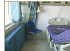
Důležité však nejsou barevné stěny a herny plné hraček, ale zdánlivě detaily, které ukazují, jak to kdesi s family-centred care myslí vážně – vlevo pod oknem je matrace připravená pro rodiče.